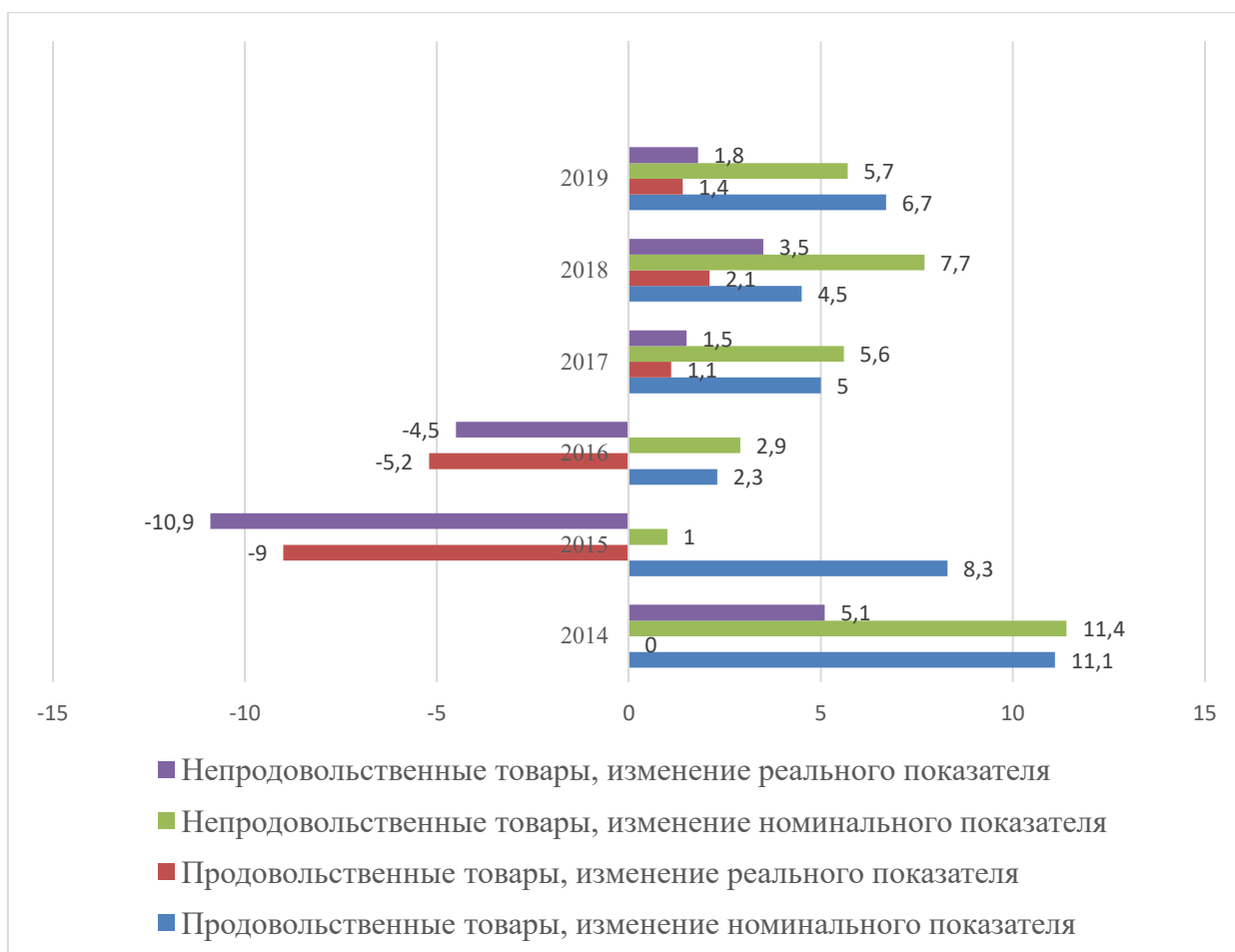
Рисунок 2 – Показатели динамики продаж на российском рынке в 2014 – 2019 гг., рост в процентах к показателю предыдущего года [4]

На фоне отсутствия на рынке розничной торговли монопольных барьеров для продвижения продукции национального производителя наблюдается рост показателя Херфиндаля-Хиршмана до некритических уровней на протяжении 2005–2020 гг. Вместе с тем рост концентрации рыночной власти в руках торговых сетей сопровождается ростом конкуренции между этими сетями, на что указывает снижение темпов роста цен на все категории, предлагаемых розничными продавцами продукции. Динамика соответствующих цен за 2011–2019 гг. представлена на рисунке 2.