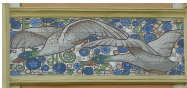
Рисунок 3 – Галилео Кини. Панель с летящими утками. 1912, майолика. Фрагмент оформления фасада виллы Дель Магро. Лукка

Галилео Кини как художник-декоратор. Протагонистом периода Либерти в Тоскане, блестящим национальным интерпретатором нового современного стиля несомненно можно назвать родившегося во Флоренции и учившегося в ее Академии Галилео Кини (1873–1956) [7, р. 368]. При рассмотрении архитектурного декора целого ряда зданий выше было отмечено, что этот мастер неоднократно и успешно участвовал в оформлении фасадов в разных тосканских городах, создавая высокохудожественные авторские композиции в технике майолики.