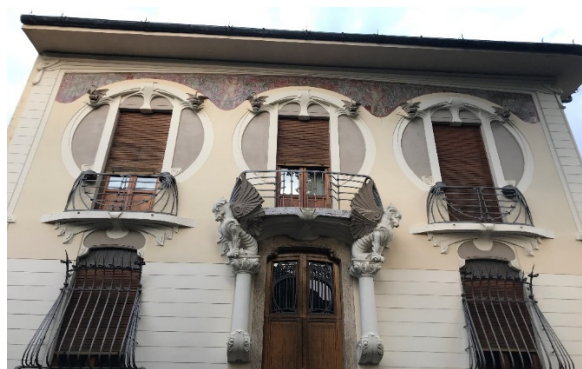
Рисунок 1 – арх. Дж. Микелацци. Дом А. Лампреди. 1908–1909. Фрагмент фасадного декора. Керамика Г. Кини. Флоренция, виа Джано Делла Белла, 13.

Декоративная композиция представляет путти с шишечками и клубящимися лентами – характерный иконографический мотив для итальянского Либерти, являвшийся символом обновления и молодости и одновременно сохранения и возрождения традиций античности.